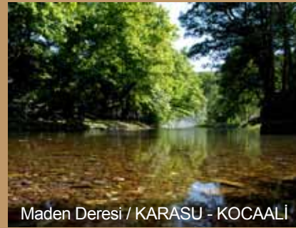
Maden Deresi / KARASU - KOCAALI