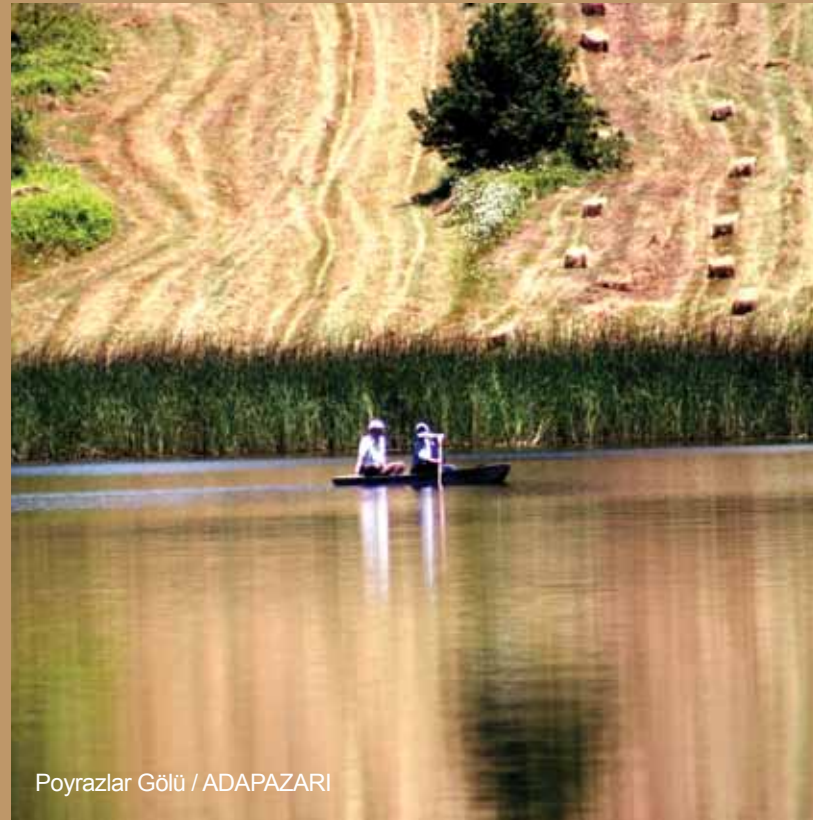
Poyrazlar Gölü / ADAPAZARI