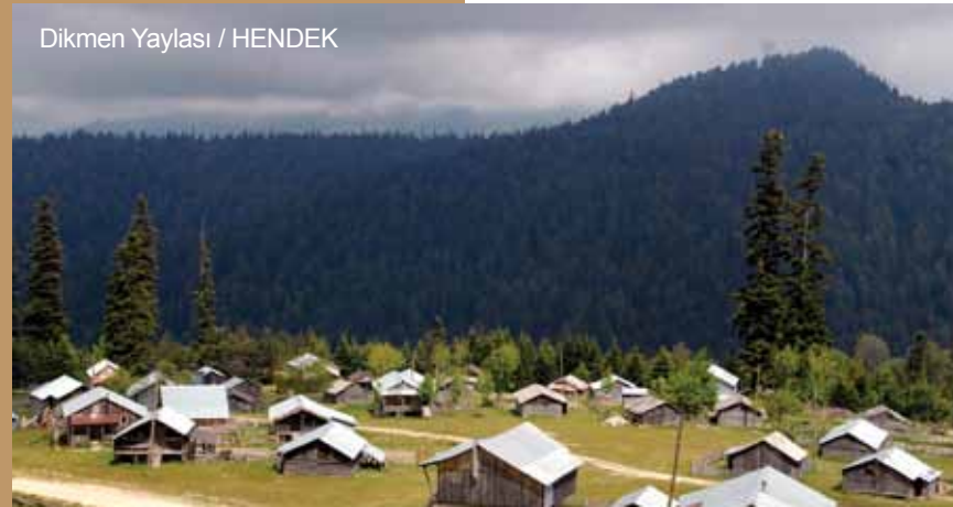
Dikmen Yaylası / HENDEK