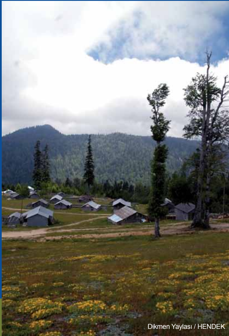
Dikmen Yaylası / HENDEK