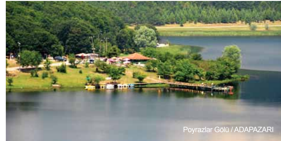
Poyrazlar Gölü / ADAPAZARI

Eskişehir'in Çifteler ilçesinden doğup Karasu'da denize dökülen Sakarya Nehri de şehrimize farklı bir güzellik katmaktadır. Sakarya hakim rengini genellikle bu nehirden ve kuzey yönünü boydan boya kaplayan Karadeniz'le göllerden almaktadır. Şehrimizin gözbebeği Sapanca gölü, artık turistik mekânlarımızdan biri olan Acarlar Longozu, merkeze yakınlığı ile yaz aylarında hafta sonları halkımızın dinlendiği Poyrazlar, Büyük Akgöl, Küçük Akgöl görülmesi gereken önemli doğal güzelliklerimizdir.