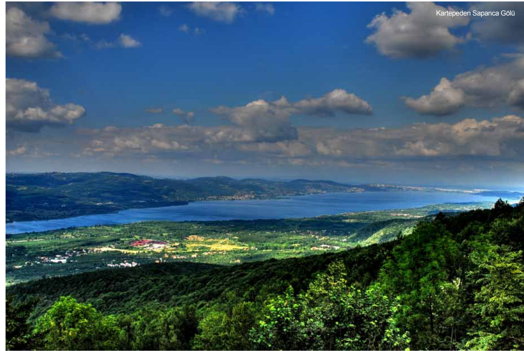
Kartepeden Sapanca Gölü