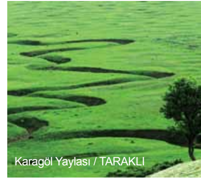
Karagöl Yaylası / TARAKLI

Karasu'dan Sapanca'ya, Kaynarca'dan Pamukova'ya kadar yeşilin ve mavinin tüm tonlarını barındıran Sakarya'nın geleceği parlaktır. Sakarya alternatif spor aktivitelerinde de iddialıdır. Rafting, akarsu kanosu, yamaç paraşütü, offroad yarışları, su kayağı faaliyetleri, sivil havacılık kampçılık faaliyetleri son yıllarda şehrimizde gelişme gösteren önemli spor aktiviteleridir. Ayrıca trekking için çalışmalar yapılmış, Sakarya'yı araçla dolaşmak isteyenler için oluşturulan "Doğa ve Kültür Yolu" gezi parkurları oluşturulmuştur.